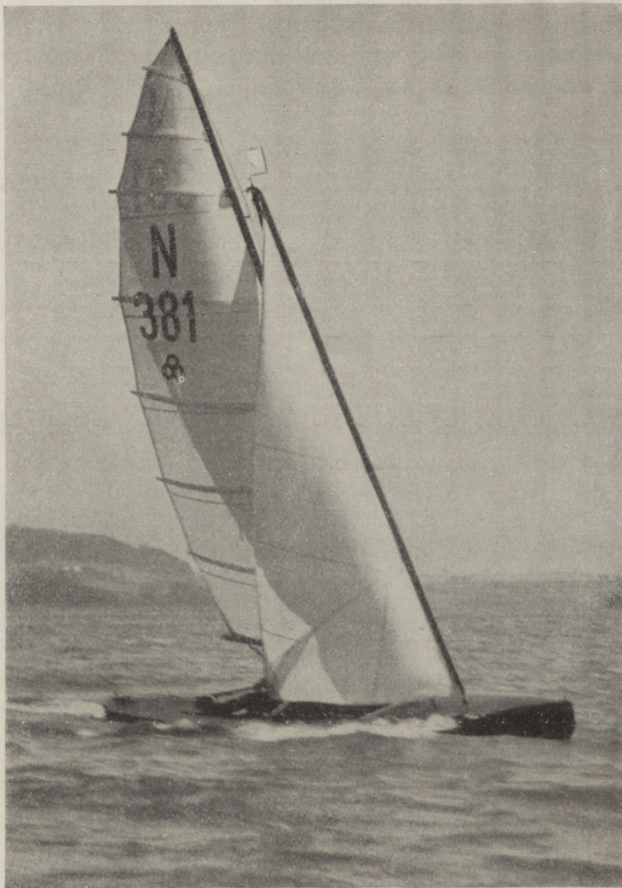
E.Z. „Isekin“, Mattsee.

Bei den Verbandswettfahrten starteten 22er, 15er und