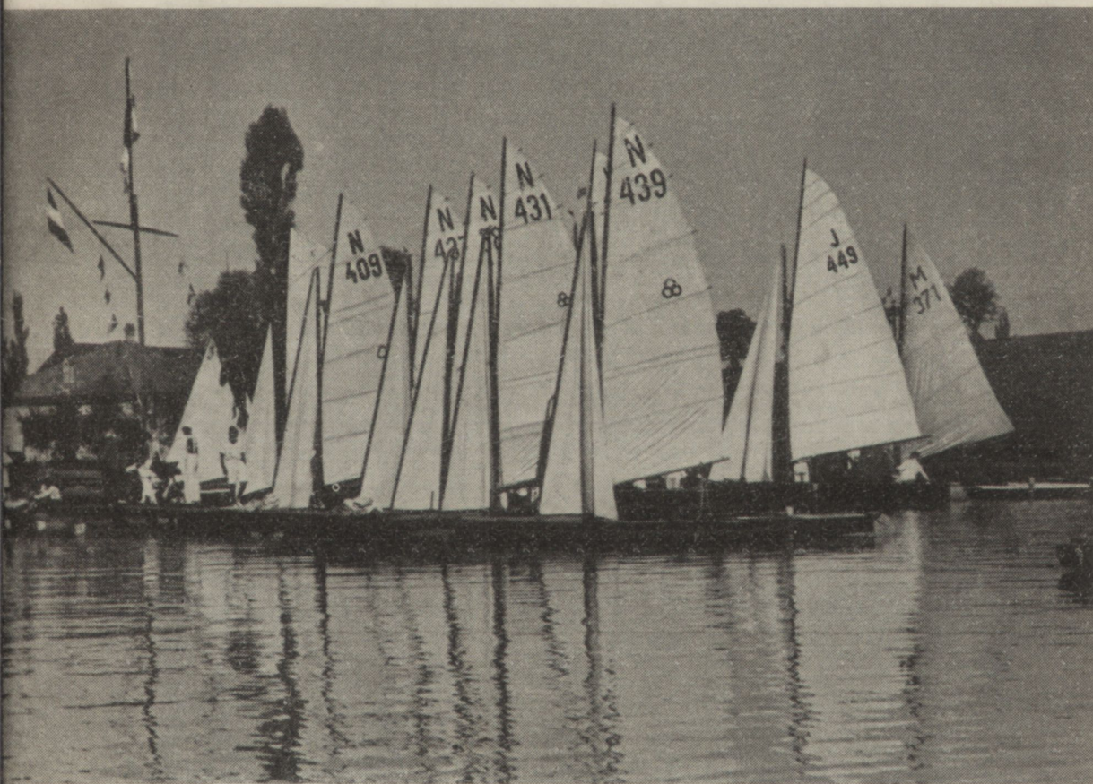
Am Steg des U.-Y.-C. vor Mattsee.

Die Wettfahrtwoche wurde mit einem Einheitszehner-Treffen eröffnet, an dem sich vier Zweigvereine mit sieben Booten be-