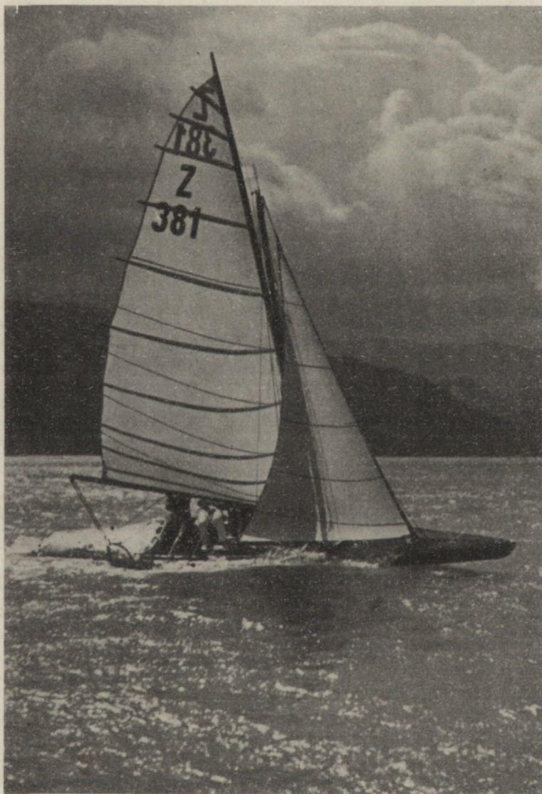
20-qm-Rennboot „Rih II“. Ing. C. Auteried.

digkeit von 20 Min./sm erreicht zu haben. „Risa“ beendete zwar diese Wettfahrt um 50 Min. vor dem nächsten Ankömmling, aber genützt hat ihr das auch nichts, die Wettfahrt war ungültig. Am nächsten Tag gabs dann gleich 2 Regatten. Beim Vormittagstart wehte es ganz frisch mit 5 bis 6 m/Sek. aus